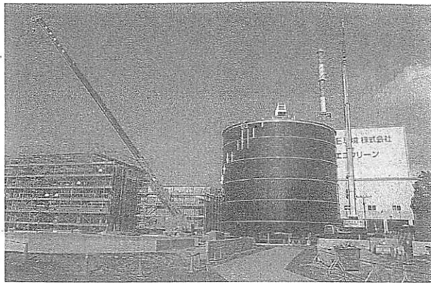
建設中のJバイオフードリサイクルのバイオガス化施設。2018年8月に事業を開始する