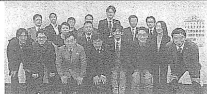
東廃協青年部から6人、一廃協青年部から11人が参加した

本誌4月号既報の通り、東京廃棄物事業協同組合（以下、東廃協）青年部と（一社）大阪市一般廃棄物適正処理協会（以下、一廃協）青年部の交流会議が2月23日、東京都新宿区にある東廃協の会議室で開催された。当日は、大阪から参加した一廃協青年部のメンバーが、東京・城南島の東京スーパーエコタウンを訪れ、食品廃棄物の飼料化施設とバイオガス化施設を視察した後、東廃協の青年部メンバーと合流、午後3時半から交流会議がスタートした。